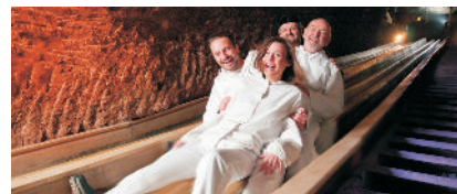
MINIERE DI SALE DI HALLEIN

Oggi il Nido dell'Aquila è un ristorante (Kehlsteinhaus), dove il gruppo farà il pranzo. a 1.834 metri sovrastando il villaggio di Obersalzberg. Al termine della visita, rientro in hotel per la cena e il pernottamento.