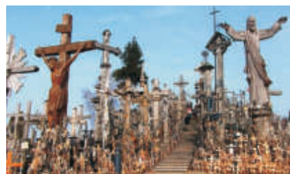
Collina delle Croci

Le immagini hanno scopo puramente illustrativo.